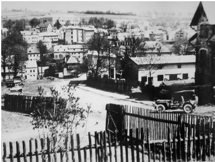
Družstevní ulice se zaparkovanou vojenskou technikou.

Nejmenovaný voják americké jednotky byl zadržen vojenskou policií poté, co podnapilý ve večerních hodinách střelbou z osobní zbraně poškodil sochu houslaře. Na hrudníku sochy houslaře vypálená střela vytvořila důlek. Naše socha houslaře tak byla jediným „mrtvým“ v našem městě během osvobození.