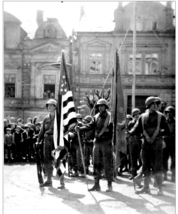
Na snímku vpravo slavnostní nástup US Army na náměstí před radnicí.