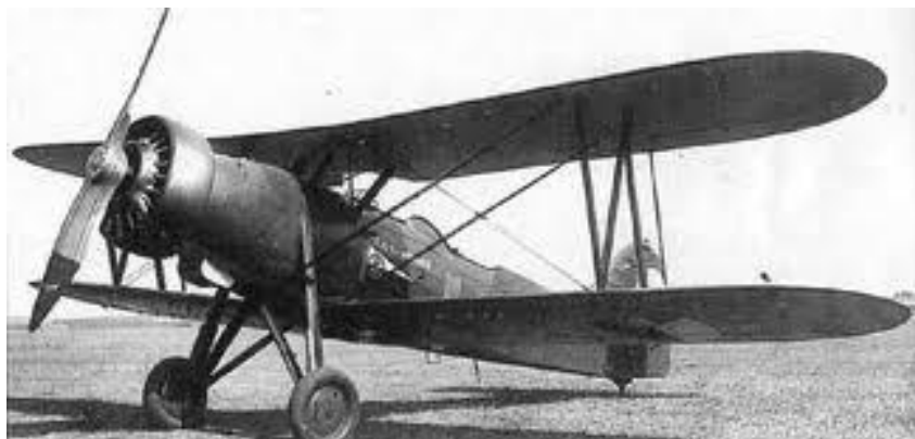
Letoun Letov Š-328

(ilustrační fotografie z knihy Chebská křídla autora Lud'ka Matějčka)