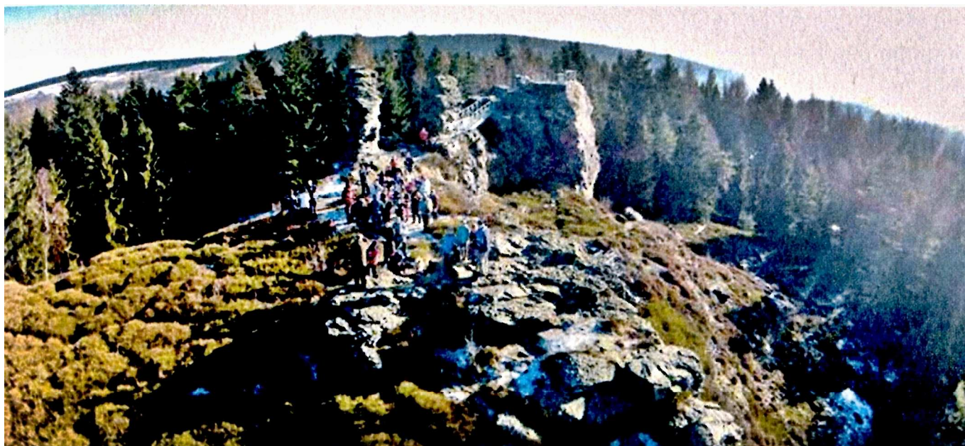
Přírodní památka Vysoký kámen