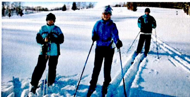
Město Luby sousedí s přírodním parkem Kamenné vrchy, zdejší příroda je i v zimě velmi podmanivá

měrou podílí na strojové úpravě popisovaných zimních běžeckých tras. Klub českých turistů v této lokalitě eviduje a udržuje zimní značení na 33 km lyžařských běžeckých tras. Pro běžkaře je také zajímavá cesta, která za Vysokým kamenem pokračuje od rozcestí Kegelberg/Kuželka směrem na Kraslice. Pro zimní běžecké lyžování využívá červenou pěší turistickou značenou trasu, jen závěrečný sjezd je veden do lyžařského areálu Skalka. Vlakem se z Lubů dostanete do Chebu, odkud můžete využít další přípoje.