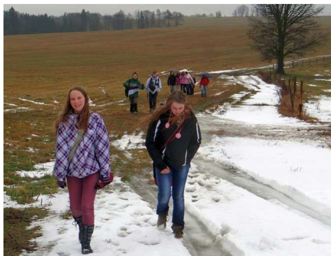
V dešti, sněhu a blátě