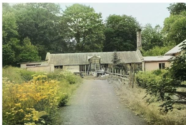
Bývalý vytápěný zámecký skleník. Budova stála v přímé ose k zámku.