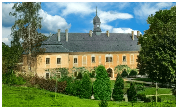
Pohled na zámek od jihu. Zámecká kuchyně byla v levém křídle v přízemí.