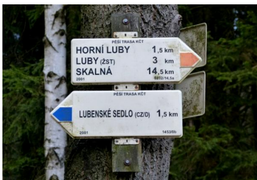
Tento ukazatel je umístěn u odstavné plochy za „dědečkárnou“

Jsem si jistý, že jsem se s pojmem Lubské sedlo setkával od dětství. Možná jsme se ho učili ve škole v zeměpisu při vymezení Krušných hor. Možná mi utkvěl v paměti z popisu Krušných hor na rubu turistické mapy 1:100 000 z 60. let, kterou už nemám. V podobném duchu „děja vu“ se vyslovila i řada náhodně oslovených znalců regionu. Po výzvě pana Zoubka se mi však zatím nepodařilo najít jméno Lubské sedlo ani v geologické a geografické literatuře, ani v desítkách historických a novodobých map. Nemám při ruce všechnu základní literaturu, takže mi mohlo leccos uniknout. Na internetu sice několikrát najdeme Lubské sedlo (Schönbacher Sattel) jako „průsmyk“ severně od Lubů, ale tyto stránky nejsou relevantním zdrojem, protože neprošly odbornou oponenturou a hledaný pojem převzaly z neznámých zdrojů. Další z pojmů, tzv. „Lubenské sedlo“, který najdeme např. na turistické mapě KČT Ašsko a Chebsko (3. vydání 1999), je jistě nesmysl, protože obec se nejmenuje Lubná, Lubno apod.