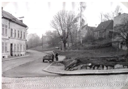
Pohled do Příčné ulice od křižovatky u zrcadla. Vpravo ještě původní domy, zbourané pro výstavbu panelových domů U Pily. Paneláky předány v listopadu 1979.