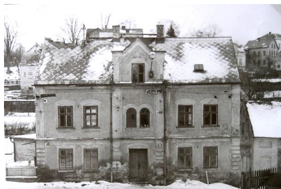
Dům v Tovární ulici stál na místě, kde byla později postavena kotelna na lehký topný olej – „mazutka“. Olejové nádrže byly vlevo naproti hasičárně, dnes parkoviště.